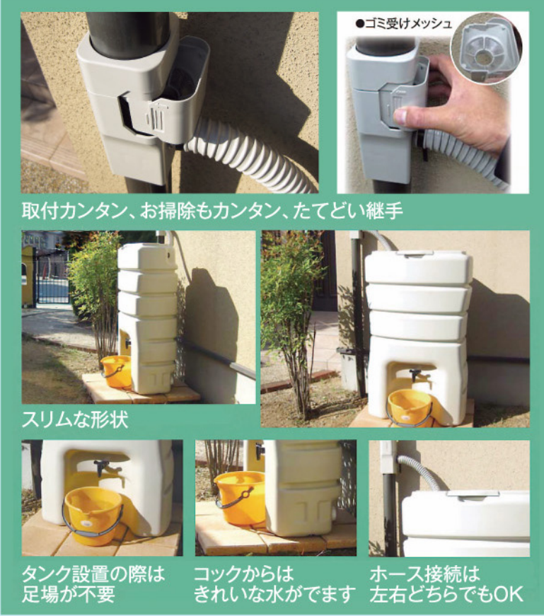
取付カンタン、お掃除もカンタン、たてどい継手

☎ 19-1 メーカー希望セット 小売価格39,000円 <取付・施工費別途> 27,800円