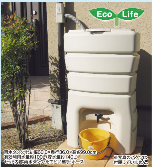
雨水タンク寸法:幅60.0×奥行36.0×高さ99.0cm 有効利用水量約100L(貯水量約140L) ※写真のバケツは付属していません ※写真のバケツは付属していません

花の水やりに! 自然の恵みを自然に返す! 塩素を含んだ水道水より雨水の方が草花も元気に育ちます。